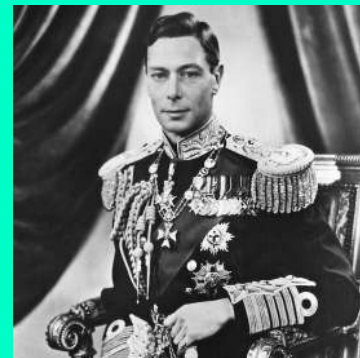
המלך ג'ורג' השישי